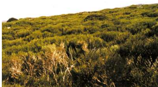
FIGURA 3. Arbustos de Cytisus con síntomas de haber sido atacados por Drymochares cylindraceus .