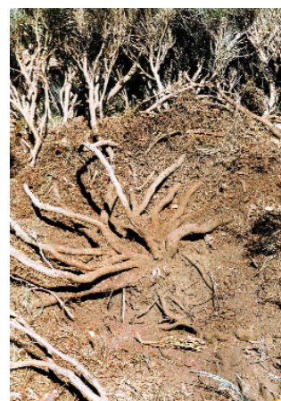
FIGURA 4. Tallos subterráneos totalmente despejados de detrito.