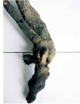
FIGURA 13. Orificio de salida del adulto en una rama de Cytisus . La línea recta representa la división «parte subterránea-parte aérea».