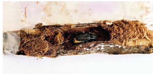
FIGURA 12. Adulto a los pocos días de completar la metamorfosis.

mes de ser fecundadas y los machos a los 15 o 20 días de haber copulado. Asimismo, y siempre en condiciones de cautividad, un macho podía copular con la misma hembra durante más de 10 días en las horas nocturnas.