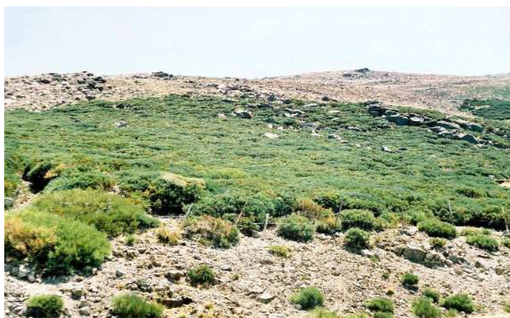
FIGURA 2. La vegetación y el paisaje de la Sierra de Candelario a partir de 1500 m de altitud están dominados por Cytisus oromediterraneus (escoba, retama o piorno serrano).